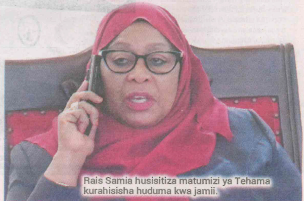
Rais Samia husisitiza matumizi ya Tehama kurahisisha huduma kwa jamii.

Aliongeza kuwa, ikiwa mwananchi atakosea kuwasilisha lalamiko lake katika taasisi husika, mfumo wa e-Mrejesho unaruhusu lalamiko hilo kuhamishwa kutoka